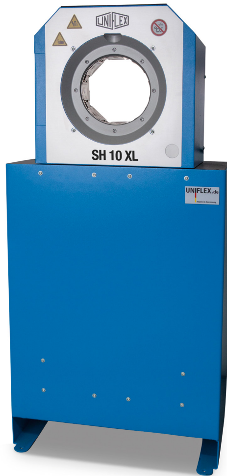
SH 10 XL

Durch die schmale, innovative Bauweise, die hohe Anwenderfreundlichkeit, Vielseitigkeit und lange Lebensdauer setzen die SH 10 und die SH 10 XL Maßstäbe für Qualität und Wirtschaftlichkeit. Ihre kompakte Bauweise und der vergrößerte Öffnungsweg von +45 mm (+1,77") bei der SH 10 und +61 mm (+2,40") bei der SH 10 XL erlauben ergonomisches Arbeiten. Der große Öffnungsweg ermöglicht das Verpressen von 90°-Armaturen bis 2 Zoll R 15 und 4 Zoll Industrie. Die bewährte schmierungsfreie Gleitlagertechnologie senkt Wartungskosten, verlängert die Lebensdauer und erhöht die Genauigkeit.