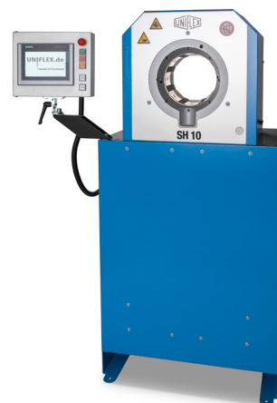
SH 10 C.2