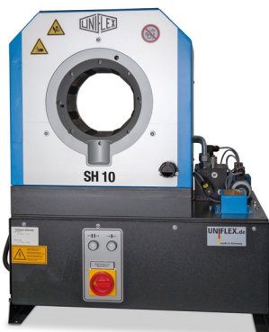
SH 10 Ecoline