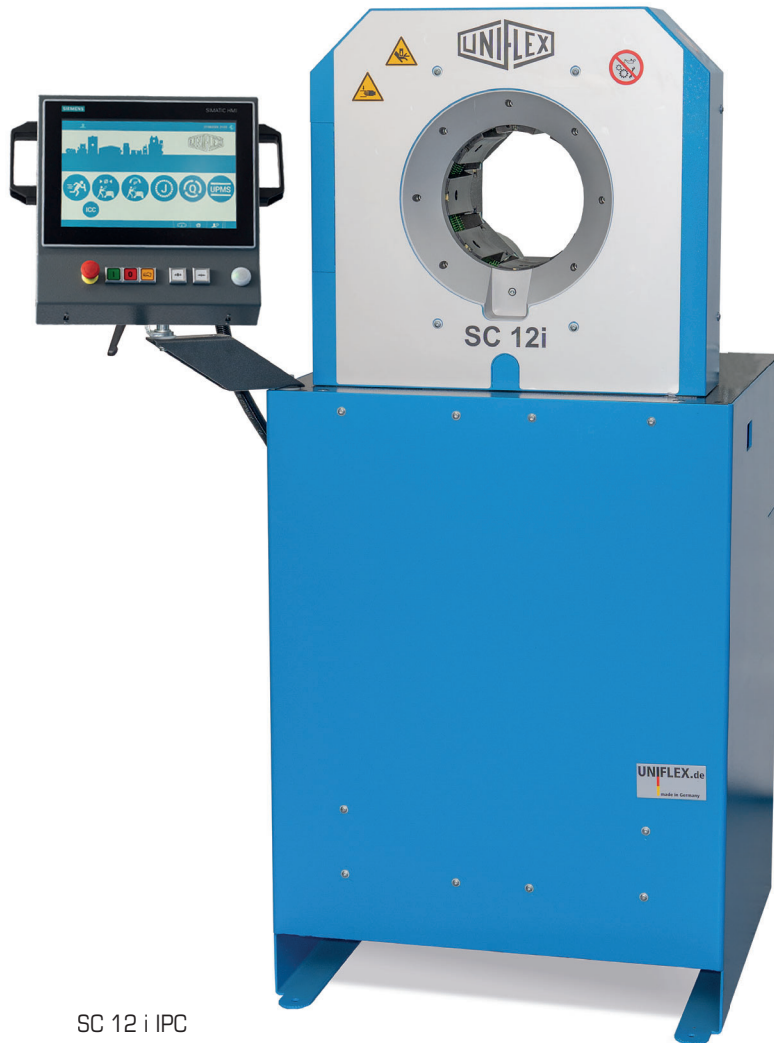
SC 12 i IPC

Mit sagenhaften 370 Tonnen Presskraft ist die SC 12 i die leistungsstärkste Werkstattpresse weltweit für hydraulische R15-Schläuche bis zu 3" und Hochdruck-Schlauchleitungen bis zu 1". Mit ihrer großen Öffnung und einem maximalen Pressbereich von bis zu 139 mm (5,47"), verpresst die SC 12 i problemlos auch 4"-Camlock-Industriefittings und sogar lange 90°-Armaturen. Die kompakte Bauweise ermöglicht allseitig direkten Zugang, besonders wichtig bei kurzen Werkstücken. Die bewährte schmierungsfreie Gleitlagertechnologie senkt Wartungskosten und steigert die Produktionsqualität. Die SC 12 i gibt es in drei Versionen: mit Mikrometer, Control C.2 oder IPC.