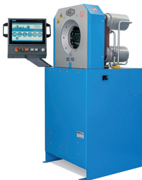
SC 12 i IPC