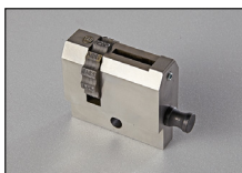
508.1003.3 (10 Typen in einer Reihe) 508.1001.3 (17 Typen verteilt auf 2 Reihen) UP 15