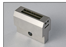
508.1002.3 (26 Typen, 13 pro Reihe)