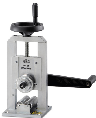
UP 10 Ecoline