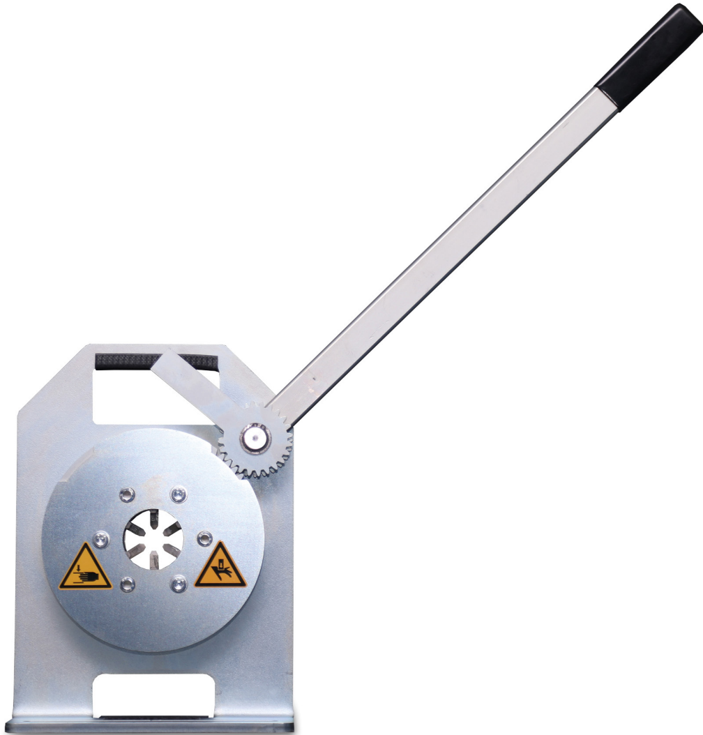
SL 3-16 M

Erleben Sie die neuesten Servicepressen für Niederdruck-Schlauchleitungen als 2-in-1-Lösung mit integrierten Backensätzen 05 und 015 für DN 03-16. Mit der SL 3-16 M präsentiert UNIFLEX die innovative Überarbeitung der bisherigen Presse mit zwei integrierten Backensätzen in einer Maschine, so dass Sie beim Wechseln der Pressbacken keine Zeit mehr verlieren. Keine andere Maschine auf dem Markt bietet diese Funktion. Wechseln Sie einfach den Griff, und schon können Sie in der anderen Größe pressen. So können Sie keine Pressbacken mehr verlegen, behalten saubere Hände und verlieren keine Zeit. Und dank des integrierten Griffs können Sie die Presse leicht überallhin mitnehmen. Die SL 3-32 M und die SL 3-75 runden das Angebot mit größeren Öffnungswegen zum Durchlass von Industrie-Armaturen bis 3" ab.