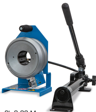
SL 3-32 M