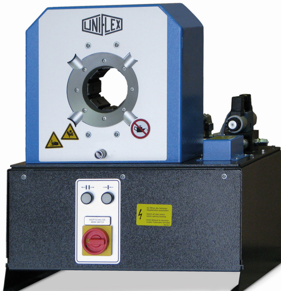
SC 3 Ecoline

Da die 4-Zylinder-Technologie den Presszunder vom Werkzeug fern hält, bietet UNIFLEX für die SC 3 und die SC 4-Serie 3 Jahre Werksgarantie.