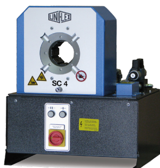
SC 4 Ecoline