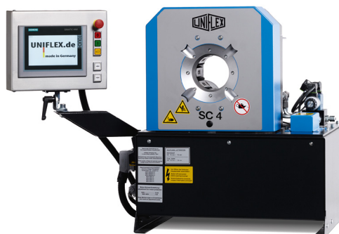
SC 4 C.2