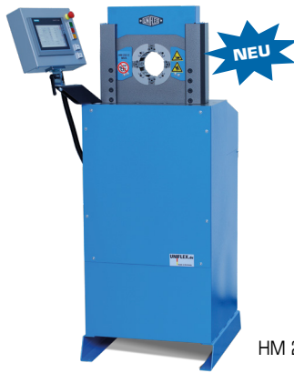
HM 222 C.2