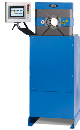
HM 225 C.2