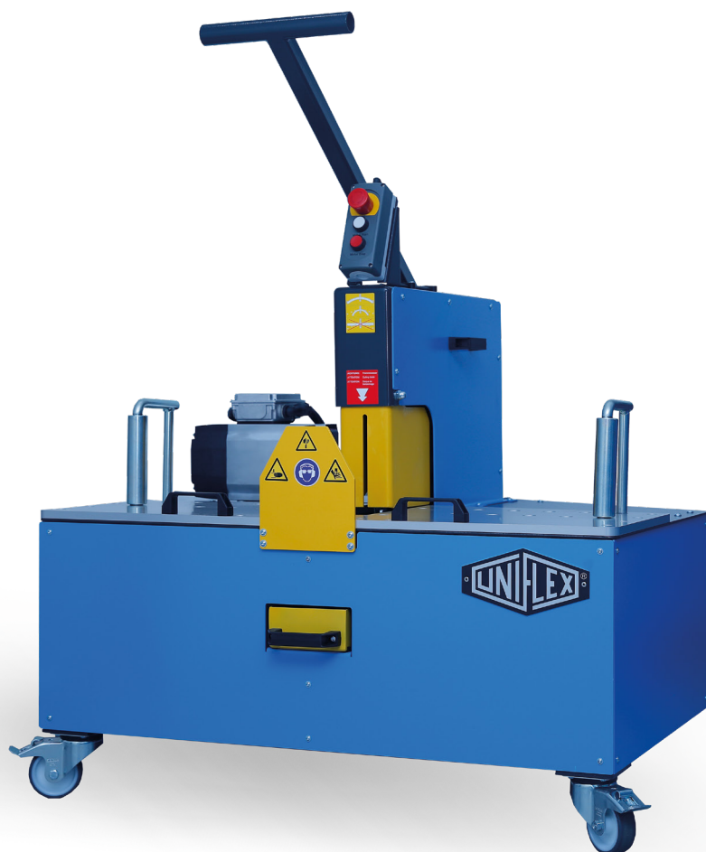
EMI 150 / EMI 200

Für beide Maschinen gewährt UNIFLEX 2 Jahre Garantie.